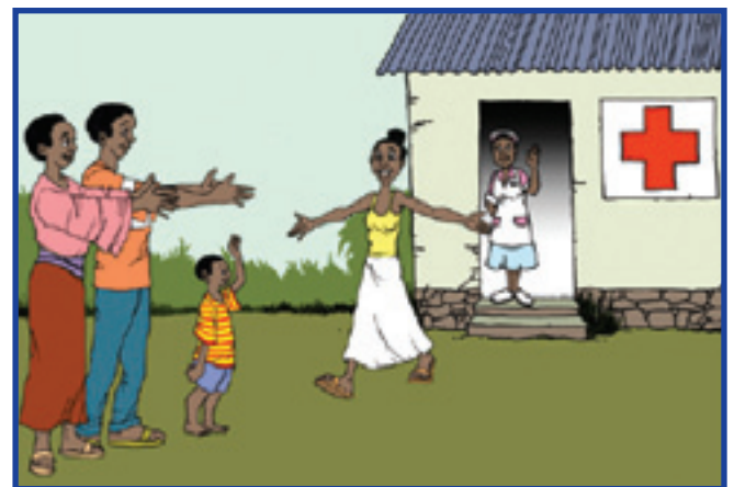
Bepi sə marâne ukin yi uləm-e sə tə gbəli kisis eŃesm! Tə sə marâne nu ukin yi uləmăŃ kă tim ĀŃibola!

Rə kə der der Ɔkin, sə tə gbiŃă ĀŃibola!