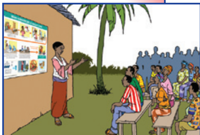
Marāne ākəlōnkəlōŃ kāmu