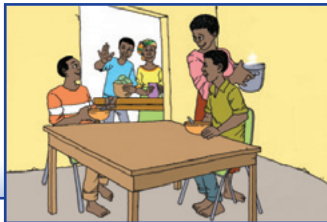
Marāne aŃfātāne amu