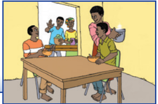
Ep yu neba den