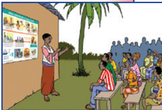
Ep yu Komyuniti